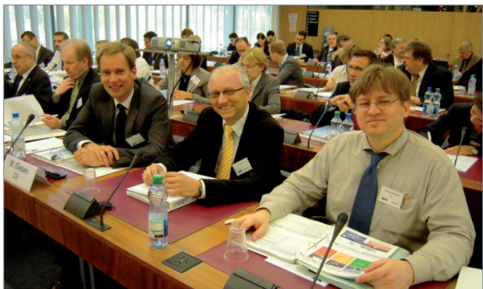
Une soixantaine de participants ont pris part aux discussions animées du workshop.