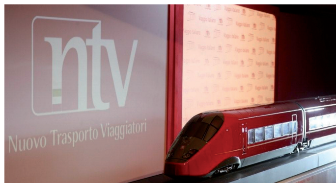
Un nouveau membre pour le CIT.

Isabelle.Oberson(at)cit-rail.org Original: DE