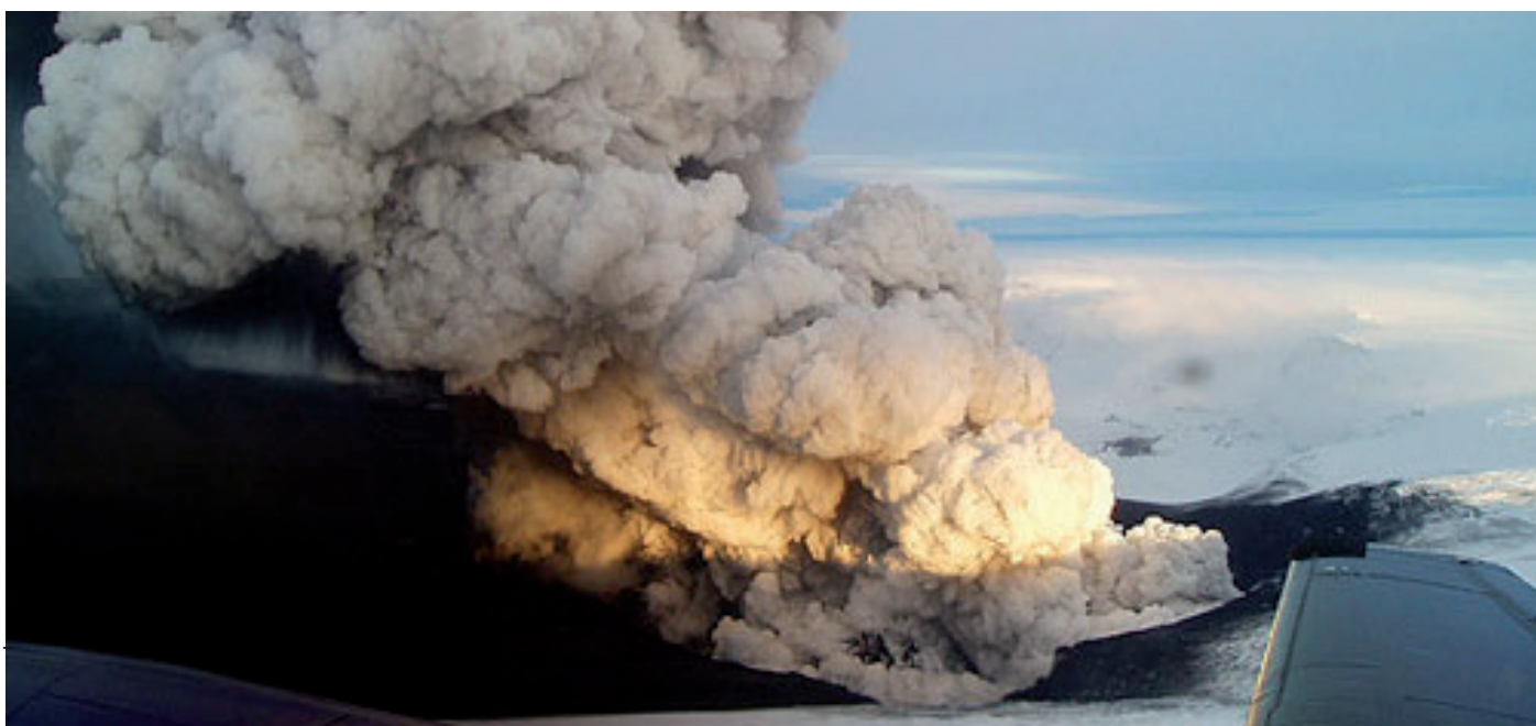
L'éruption du Volcan Eyjafjöll a mis en lumière les ambiguïtés de la législation européenne sur les droits des passagers aériens.

Isabelle.Oberson(at)cit-rail.org Original: FR