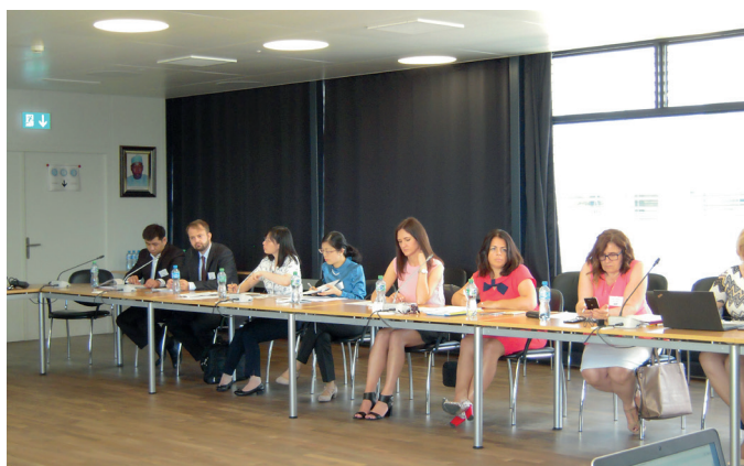
VertreterInnen aus diversen Ländern von der VR China bis Frankreich und aus Kasachstan über Russland bis Deutschland

erik.evtimov(at)cit-rail.org Original: DE