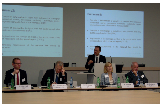
Die Informationsübertragung bleibt ein wichtiges Thema, welches während der CIT Konferenz erörtert wurde

Die Hauptaufgabe im zweiten Teil der Konferenz war es, gestützt auf die einleitend dargestellten Grundlagen mit den anwesenden Experten, die Nutzung elektronischer Kennzeichnungsverfahren für die Verwendung von elektronischen Dokumenten für die Beförderung von Gütern unter öffentlich-rechtlichen Restriktionen zu erörtern. Die Fragestellung könnte dann auf die Beförderung anderer bewilligungspflichtiger Güter erweitert werden, die wegen öffentlich-rechtlicher Vorschriften besonders zu dokumentieren sind.