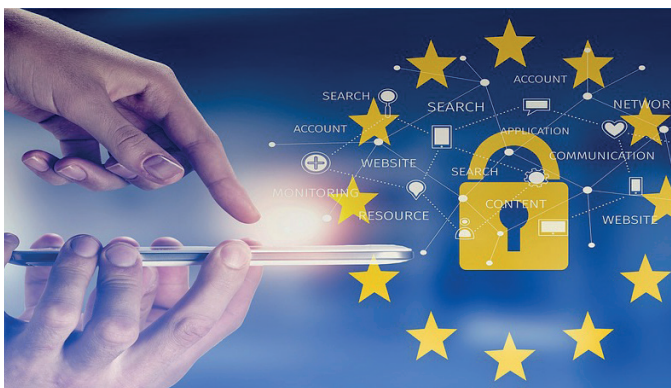
Der Datenschutz ist ein Kernanliegen der Eisenbahnunternehmen

Entgegen der teilweise geäusserten Meinung, handelt es sich nicht um eine Revolution. Ein Rechtsrahmen bestand bereits und viele Unternehmen und Personen, die personenbezogene Daten verarbeiten, hatten bereits Massnahmen ergriffen. Die Umsetzung der GDPR setzte jedoch ein kollektives Bewusstsein in Gang, nicht bloss für den (nicht nur finanziellen) Wert der personenbezogenen Daten, sondern auch über deren Schutzwürdigkeit.