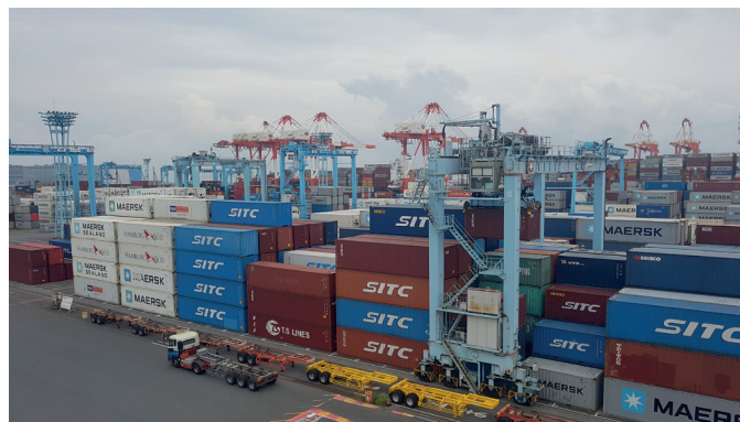
Überwachung der Ladung und Aufrechterhaltung der Ladungssicherheit ist ein Themenkomplex des Forums

erik.evtimov(at)cit-rail.org Original: DE