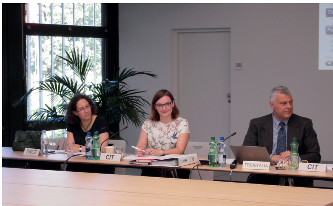
Datenschutz, Ticketing, Digitalisierung: Ein umfangreiche Tagesordnung für den Ausschuss CIV

Um die guten Praktiken der Unternehmen im Bereich der Klauseln für die Information der Reisenden über die Behandlung ihrer personenbezogenen Daten beim Abschluss eines Eisenbahnbeförderungsvertrages zusammenzutragen, wird dieses Jahr zudem die Expertengruppe Datenschutz beigezogen.