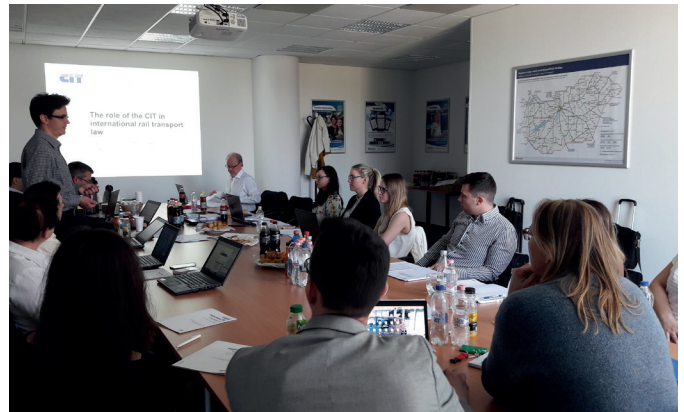
Eine zielgerichtete Ausbildung für die CIT-Mitglieder