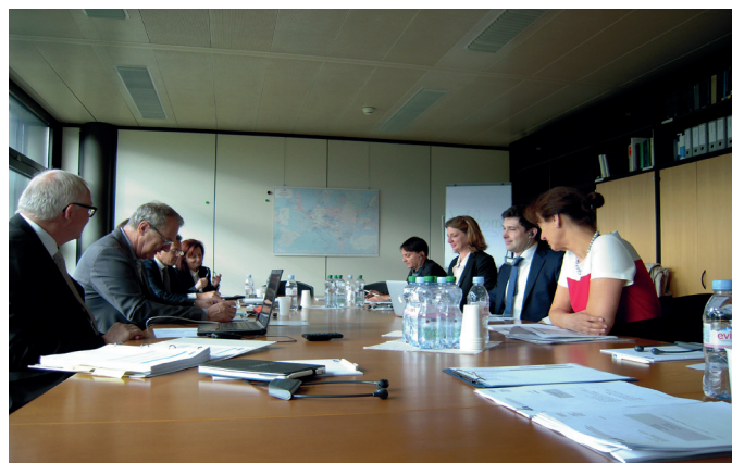
Mitglieder des Vorstandes in Bern

cesare.brand(at)cit-rail.org Original : DE