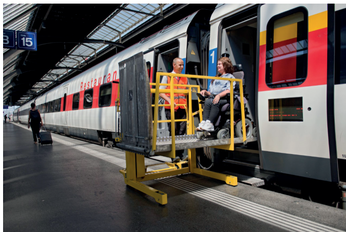
Assistance fournie en gare par le personnel ferroviaire

Le projet, ainsi modifié, doit encore être voté en plénière au sein du Parlement européen, vote qui ne devrait pas avoir lieu avant décembre 2018/début 2019. Aucune date ne peut encore être communiquée s'agissant du Conseil.