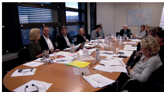
Séance du groupe de travail CIM

Afin d'éviter des discussions superflues à l'avenir et l'insécurité qui en découle, le GT CIM a commencé à analyser les aspects juridiques des différents nouveaux modèles d'exécution des transports et à structurer ces derniers à l'aide de schémas. Ceci permet d'éviter de mélanger des questions opérationnelles comme par exemple les décomptes et les questions contractuelles. Le SG CIT reviendra dans le détail sur les résultats de ces travaux dans le courant de l'année 2019 dans les prochains numéros du CIT-Info.