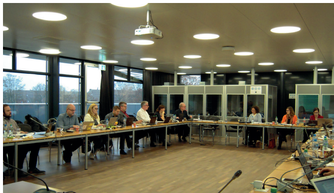
Ticketing et digitalisation : les nouvelles technologies soulèvent de nombreuses questions juridiques

La technologie de la blockchain est en plein développement dans de nombreux secteurs. Elle pourrait être utile pour le transport de voyageurs, notamment pour la distribution et le ticketing, ou encore le traitement des réclamations. Les projets en ce domaine restent pour l'instant confidentiels, même si certains MaaS semblent utiliser cette technologie pour certains aspects de leur service. En tous les cas, cette technologie repose sur un programme informatique codifiant un contrat dont tous les éléments sont connus à l'avance, afin d'être mis en œuvre de façon totalement automatique. Pour le CIT, l'élaboration de ce « smart contrat » est déterminante pour la relation entre le client et les transporteurs ainsi que les autres intervenants dans la distribution.