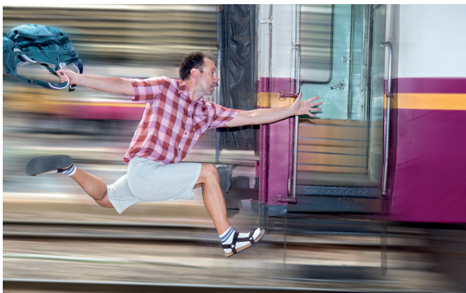
Ce projet met en avant la protection des passagers et de leurs droits

Après un premier projet de rapport favorable publié par le Rapporteur de la Commission TRAN, le vent a toutefois vite tourné en défaveur des entreprises ferroviaires, avec la publication des amendements de la Commission TRAN en octobre 2018.